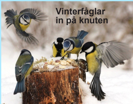
Vinterfåglar in på knuten

Denna helg är vi många som försöker bidra med att räkna besökande fåglar på våra fågelbord och som rapporterar resultatet till Sveriges Ornitologiska förenings fågelbordsräkning. www.sofnet.org